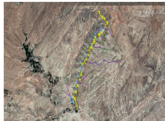
Fig. 2 River Path and GPS points

در این تحقیق سعی شده از رابطه‌هایی استفاده شود که فراسنجه‌های مورد نیاز آنها وجود داشته یا قابل برآورد باشند. بدین منظور با استفاده از نقشه‌های DEM، شبکه آبراهه‌ها و مدل رقومی ارتفاع منطقه، اطلاعات هندسی منطقه در نرم‌افزار ARC-GIS محاسبه شد. پس از آن با انجام بازدیدهای میدانی، پیمایش رودخانه اصلی، عکس‌برداری از رودخانه و ساحل‌ها، در بازه‌های مختلف انجام شد. شکل شماره ۲ تصویر ماهواره‌ای از رودخانه را نشان می‌دهد که نقطه‌های خروجی دستگاه GPS در بازدید میدانی روی آن نمایش داده شده است. در این شکل ۵۶ نقطه از ابتدای رودخانه تا خروجی حوضه برداشت شده است که با توجه به طول ۳/۵ کیلومتری رودخانه به طور میانگین هر ۶۲ متر یک نقطه برداشت شده است.